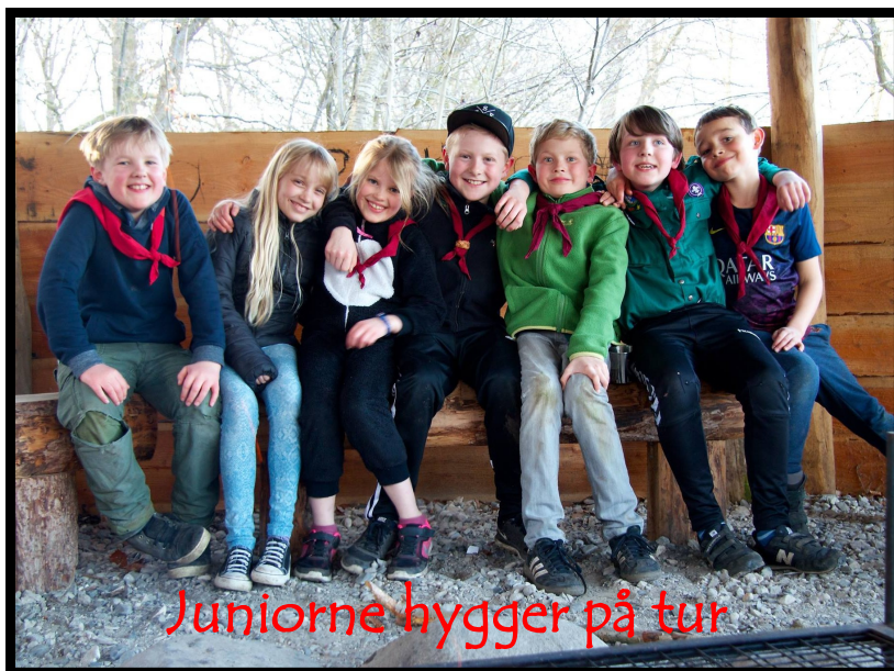
Juniorerne hygger på tur