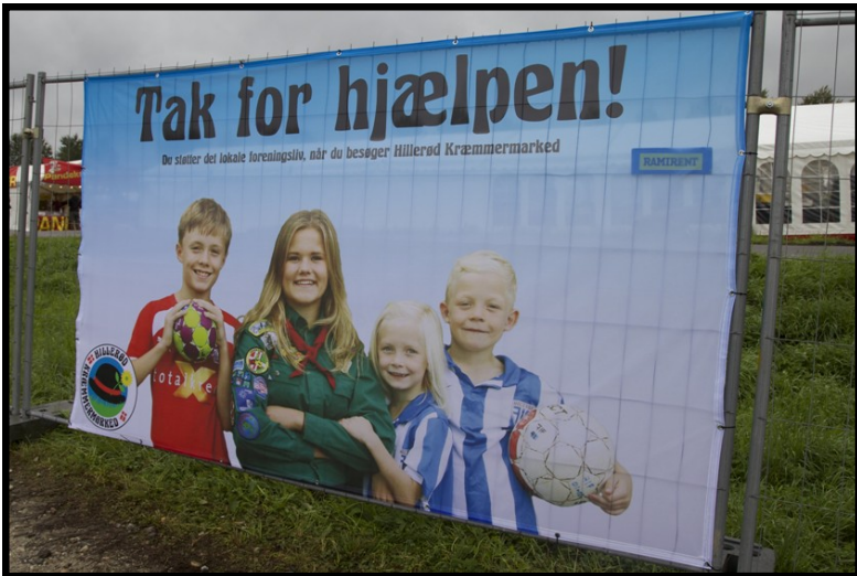
Vi var tydelige på banner og kom i Hillerødposten