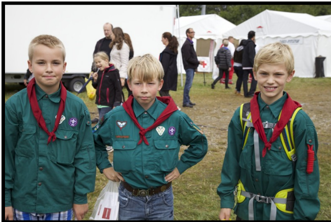
Salg af rundskuehæfter.

Her er et udpluk af billeder der blev taget. Video og billeder vil blive redigeret og lagt på hjemmesiden.