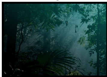
Mange ulvehilsner Ulvelederne