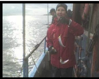
Der bliver fanget,