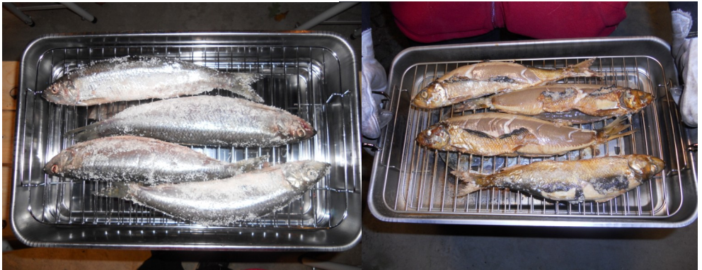
Før og efter, og efter igen nedenunder

Også røgningen gik fint – vi skulle dog ikke have brugt så meget salt.