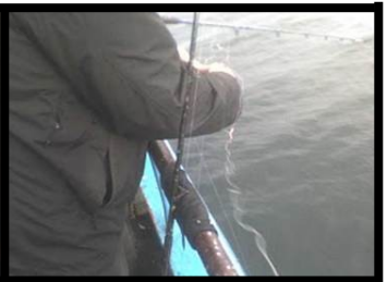
Også "naboens" line blev fanget