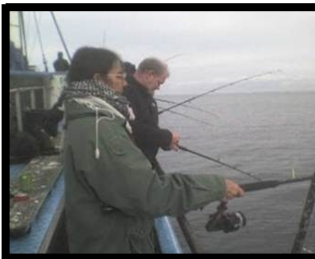
Der bliver fisket,