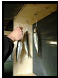
Fiskene er nu saltet og hænges til lufttørring