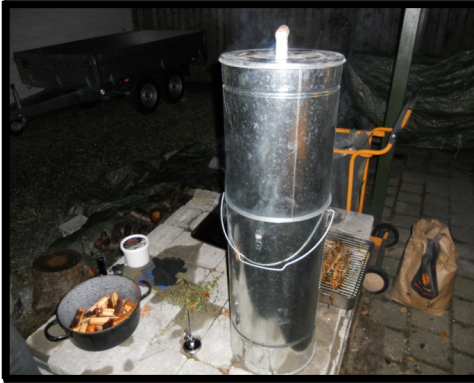
Så bliver der røget