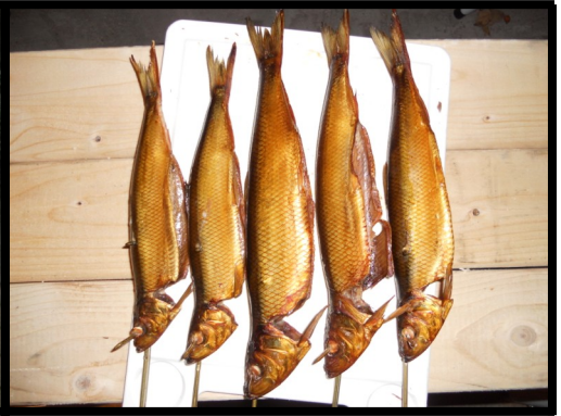
Meget flotte røgede sild